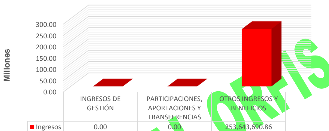
GRÁFICA 1 INGRESOS

Fuente: Estado de Actividades y documentación presentada por la Secretaría de Trabajo, Previsión Social y Productividad.